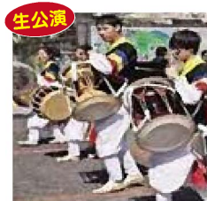
日本文理大学 サムルノリチーム「マダン」

今回の舞台では、特別に日本文理大学サムルノリチーム「マダン」、庄内子供神楽を生公演します。